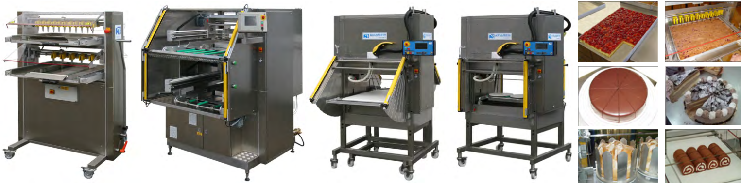
Felierea orizontală Горизонтальная нарезка